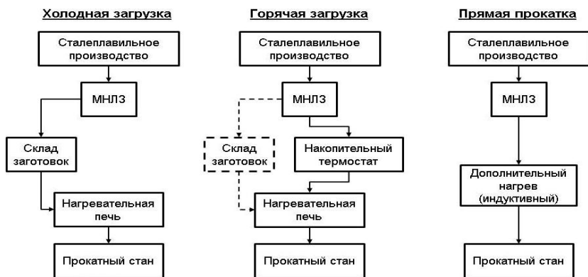
Рисунок 1 – Производственный процесс между УНРС и прокатным станом

Наиболее эффективный вариант состыковки МНЛЗ с прокатным станом при применении непрерывнолитой заготовки квадрат 130 и 150 мм из углеродистых и низколегированных марок стали, в котором применяется комплекс оборудования, в основе которого лежит печь-термостат для заготовки длиной 120 м. Данный способ состыковки позволяет сократить расход энергии на нагрев заготовки не менее, чем на 53%.